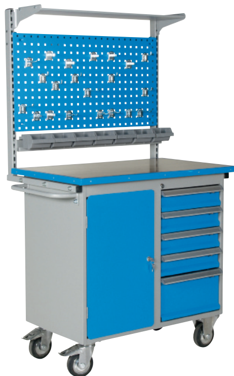
Арт. № 74020+74040