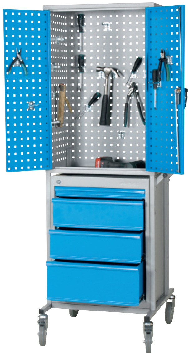
Арт. № 74070