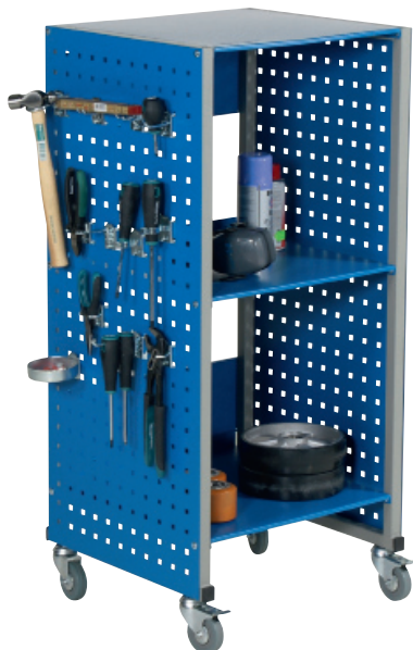
Арт. № 74010