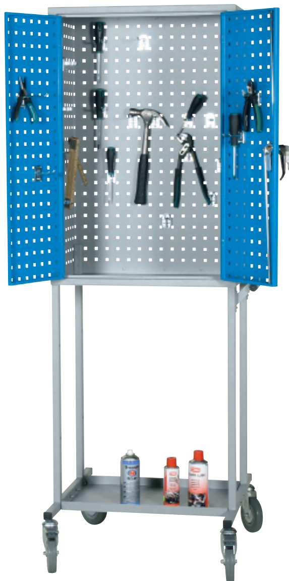
Арт. № 74060