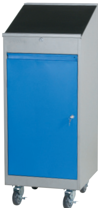
Арт. № 71400