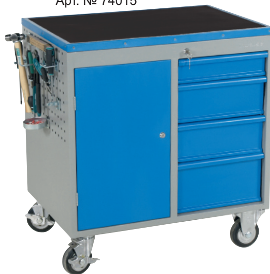
Арт. № 74015