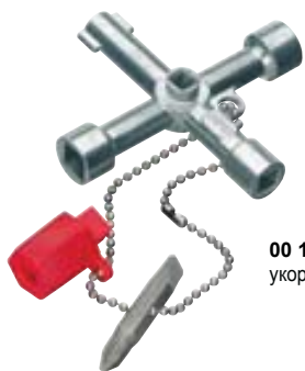
00 11 02 укороченная конструкция, длина - 44 мм