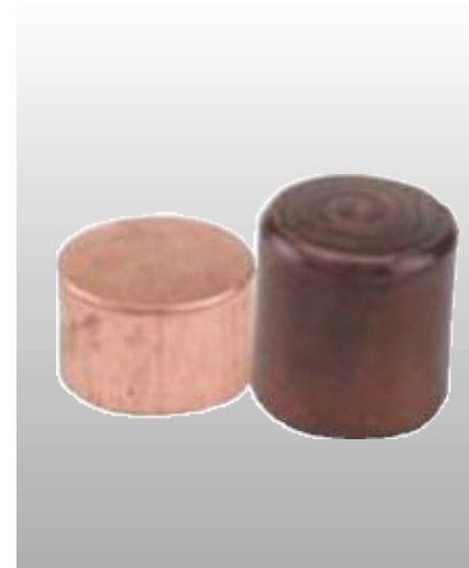
D21826 СМЕННЫЙ МЕДНЫЙ БОЕК ДЛЯ МОЛОТКА D20070 Диаметр 32 мм. Продается без упаковки.

Профессиональное качество. Два бойка (медный и кожаный) смонтированы в головку, изготовленную из ковкого железа. Медный боек позволяет предотвратить разрушение деталей при проведении монтажных и демонтажных работ. Боек из кожи применяется при работе с материалами, на которых недопустимо появление вмятин. Эргономичная деревянная рукоятка. Диаметр бойков 38 мм, вес молотка 1100 гр. Без упаковки.