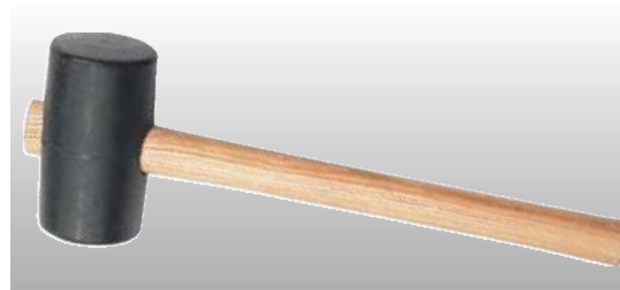
D11919 РЕЗИНОВАЯ КИЯНКА

Профессиональное качество. Изготовлена из полужесткой резины, обладающей небольшой отдачей. Диаметр 65 мм, вес 450 гр. Полированная рукоятка из ясеня. Без упаковки. Изготовлена в соответствии с техническими условиями DIN 5128.