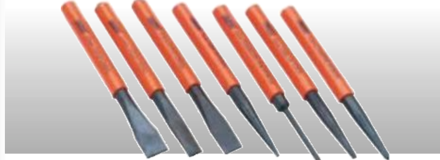
D13038 НАБОР УДАРНО-РЕЖУЩЕГО ИНСТРУМЕНТА, 7 предметов

Инструменты изготовлены из закаленной и отпущенной хром-ванадиевой стали, химически тонированной в черный цвет. Пластиковые рукоятки. Прозрачная упаковка.