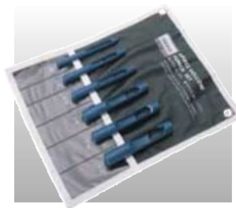
D25995 НАБОР ПРОБойНИКОВ КРУПНЫХ ОТВЕРСТИЙ, 6 ПРЕДМЕТОВ

Изготовлены из качественной закаленной углеродистой стали с эмалевым покрытием. Предназначены специально для пробивания аккуратных отверстий в коже, бумаге, пластике, дереве и пр.