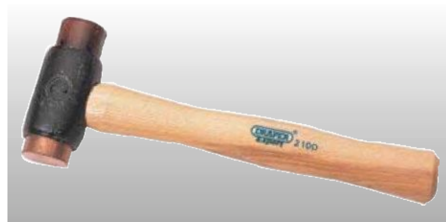
D20070 ДВУХКОМПОНЕНТНЫЙ МОЛОТОК

Киянка с резиновой головкой. Рукоятка, изготовленная из стекловолокна, имеет ручку с резиновым покрытием для улучшения захвата. Особенно удобна при мощении и других подобных работах.