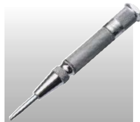
D13612 АВТОМАТИЧЕСКИЙ КЕРНЕР

Профессиональное качество. Усиленное подпружиненное жало из закаленной стали. Регулируемая сила удара. Длина 125 мм. Прозрачная упаковка.