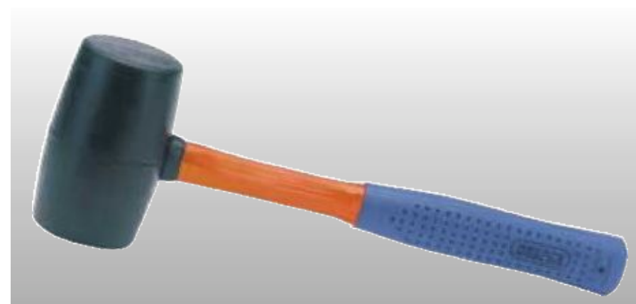
D72020 РЕЗИНОВАЯ КИЯНКА С РУКОЯТКОЙ ИЗ СТЕКЛОВОЛОКНА, 750 ГР

Профессиональное качество. Изготовлена из полужесткой резины, обладающей небольшой отдачей. Диаметр 65 мм, вес 450 гр. Полированная рукоятка из ясеня. Без упаковки. Изготовлена в соответствии с техническими условиями DIN 5128.