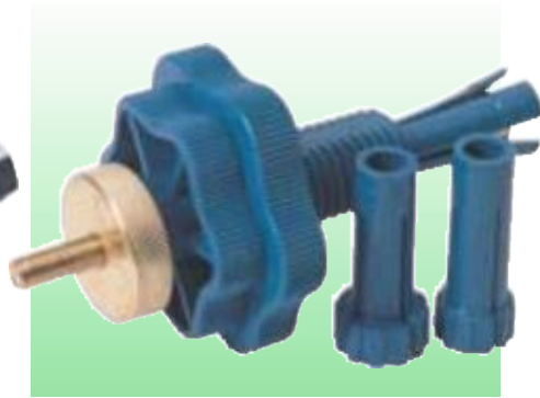
D52329 УНИВЕРСАЛЬНЫЙ НАБОР ДЛЯ ЦЕНТРОВКИ СЦЕПЛЕНИЯ (CLUTCH MATE®)

Революционная технология, применяемая при изготовлении набора, позволяет быстро и точно отцентрировать сцепление и нажимной диск сцепления перед их установкой. Подходит к большинству типов автомобилей весом до 5 тонн, за исключением автомобилей с двухдисковым сцеплением. Корпус изготовлен из сополимера акрилонитрила с латунным винтом. В комплект входят 3 патрона. Прозрачная упаковка.