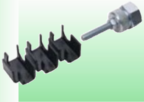
СЪЕМНИК СЦЕПЛЕНИЯ GM (VAUXHALL/OPEL), 4 ПРЕДМЕТА

Предназначен для автомобилей, производства компании GM (Vauxhall/Opel) с поперечно расположенными двигателями, такими как модели Nova, Corsa, Astra, Belmont, Kadett, Cavalier, Vectra и Ascona. Предназначен для работы вместе с ударным съёмником производства компании Draper (артикул 19194). В комплект входят 3 захвата и адаптер съёмника ведущего вала. Адаптер имеет внутреннюю резьбу 5/8". Указанные три захвата могут также поставляться отдельно. Упаковка – прозрачная.