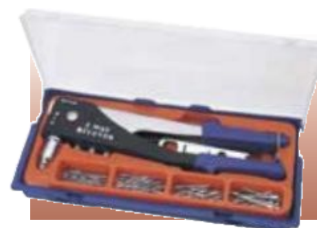
ЗАКЛЁПОЧНИК С НАБОРОМ ЗАКЛЁПОК Универсальный заклёпочник с переставным патроном, что позволяет работать под 90° и под 180°. Рабочие губки изготовлены из хромомолибденовой стали. В комплект входят 4 головки, предназначенные для односторонних заклёпок, изготовленных из алюминиевого сплава, размерами 2,4, 3,2, 4,0 и 4,8 мм. В набор входят приблизительно 60 заклёпок различных размеров, ключ для головок и пластиковый переносной футляр. Упаковка – прозрачная.

Артикул описание D19782 Заклёпочник с набором заклёпок D68942 Запасные рабочие губки* * Продаются отдельно