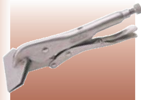
D14027 РУЧНЫЕ ТИСКИ ДЛЯ ЛИСТОВОГО МЕТАЛЛА Изготовлены из высококачественной стали с покрытием из никеля. Оснащены рычагом быстрого освобождения. Длина 240 мм. Картонная упаковка.