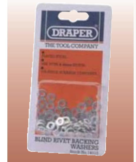
ЗАКЛЁПОЧНЫЕ ШАЙБЫ Предназначены для использования только с заклёпками, перечисленными в разделе «ЗАКЛЁПКИ ОДНОСТОРОННИЕ». Используются для повышения прочности и надёжности клепания односторонними заклёпками. В упаковке в среднем 100 штук. Упаковка – прозрачная.