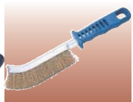
D20594 УНИВЕРСАЛЬНАЯ ПРОВОЛОЧНАЯ ЩЕТКА Профессиональное качество. Предназначена для зачистки металла перед сваркой и для удаления окалины после ее завершения, а также для общих зачистных работ. Щетина диаметром 0,35 мм жестко переплетена и надежно закреплена внутри металлического корпуса. Пластиковая рукоятка. Длина 250 мм. Прозрачная упаковка.