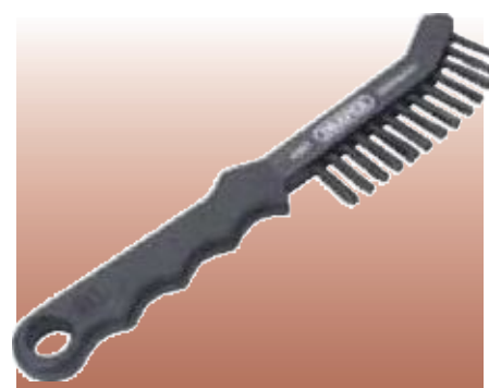
D11951 СТАЛЬНАЯ ПРОВОЛОЧНАЯ ЩЕТКА Профессиональное качество. Ручья изготовлена из жесткой формованной пластмассы и имеет загнутый конец для удобства чистки углов. Проволока из закаленной и отпущенной стали. Длина 225 мм. Прозрачная упаковка.