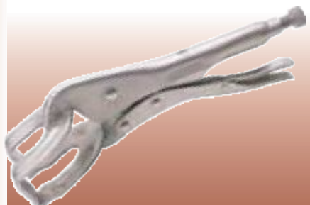
D81650 РУЧНЫЕ ТИСКИ ДЛЯ СВАРОЧНЫХ РАБОТ Изготовлены из высококачественной стали с покрытием из никеля. Оснащены рычагом быстрого освобождения. Длина 280 мм. Картонная упаковка.