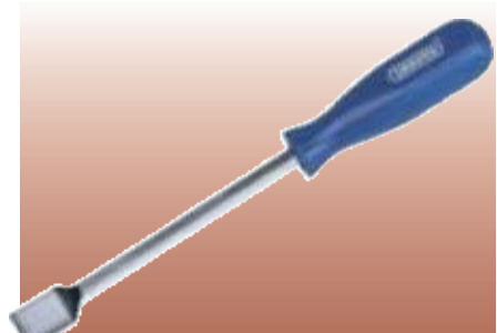
D36923 ШАБЕР ПЛОСКИЙ Изготовлен из закалённой углеродистой стали с хромированным покрытием. Имеет лезвие с дробеструйной обработкой. Предназначен для очистки головок цилиндров, удаления остатков уплотнителей, клеев и пр. Упаковка – прозрачная.