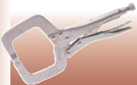
D81642 РУЧНЫЕ ТИСКИ ГЛУБОКОГО ЗАХВАТА Изготовлены из высококачественной стали с покрытием из никеля. Оснащены рычагом быстрого освобождения. Длина 280 мм. Картонная упаковка.