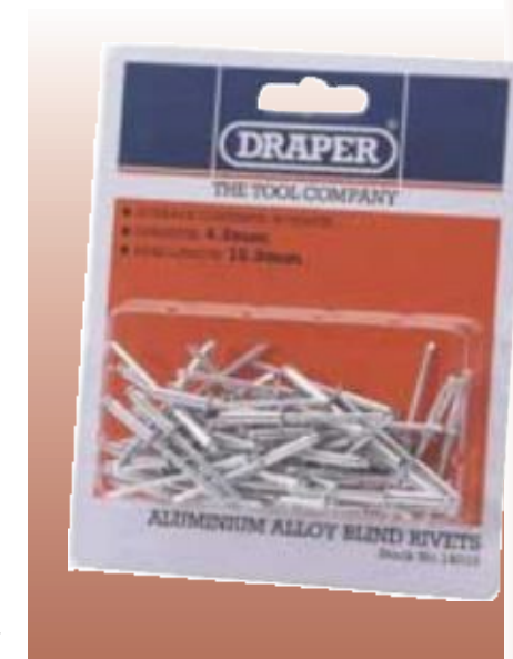
ЗАКЛЁПКИ ОДНОСТОРОННИЕ Алюминиевые заклёпки со стальным сердечником. В упаковке в среднем 50 штук. Упаковка – прозрачная