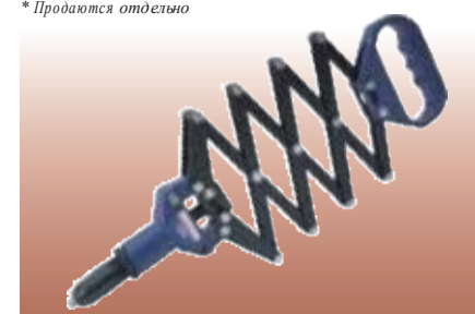
ЗАКЛЁПОЧНИК МНОГОРЫЧАЖНЫЙ Профессиональное качество. Специально разработан для часто повторяющихся операций при интенсивном использовании. Имеет сверхпрочный рычажный механизм ножничного типа и патрон, изготовленные из углеродистой стали, литую алюминиевую ручку, покрытую лаком, и рабочие губки, изготовленные из закалённой хромомолибденовой стали. В комплект входят 4 головки, предназначенные для односторонних заклёпок, изготовленных из алюминиевого сплава, нержавеющей и обычной стали, размерами 2,4, 3,2, 4,0 и 4,8 мм. Упаковка – прозрачная.

Артикул описание D19782 Заклёпочник с набором заклёпок D68942 Запасные рабочие губки* * Продаются отдельно