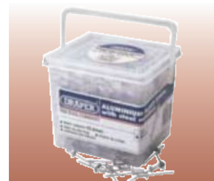
ЗАКЛЁПКИ ОДНОСТОРОННИЕ, В ТУБАХ Алюминиевые заклёпки со стальным сердечником.