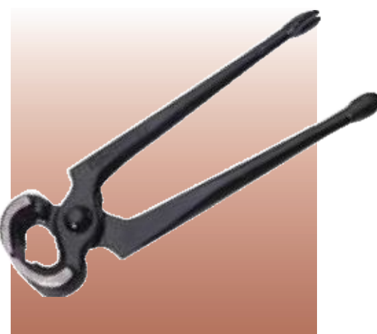
D50829 КЛЕЩИ СТОЛЯРНЫЕ, 175MM Изготовлены из высококачественной закалённой стали методомковки. Губки подвергнуты индукционной закалке. Рукоятки покрыты черным лаком. Упаковка – прозрачная.