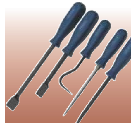
D35100 НАБОР ИЗ 5 СКРЕБКОВ И МИНИЗАЦЕПОК Предназначен для различных операций, таких как демонтаж шплинтов, шлангов радиатора, удаление отслаивающейся краски и уплотнений. Лезвия выполнены из закаленной и отпущенной углеродистой стали. Прозрачная упаковка. Комплект: • 2 многофункциональных скребка, 210 и 275 мм • Шило, 200 мм • Съёмник шпонок, 225 мм • Съёмник радиаторных шлангов, 175 мм