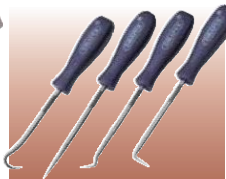
D35099 НАБОР ИЗ 4 МИНИЗАЦЕПОК Предназначен для удобного демонтажа уплотнительных колец, шплинтов, шпилек и т.д. в различных механических устройствах. Лезвия произведены из закаленной и отпущенной нержавеющей стали. Ударопрочные ручки. Прозрачная упаковка. Комплект: шило, зацепки с полукруглым, "Г"-образными и "V"-образным крючками.