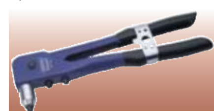
ЗАКЛЁПОЧНИК Профессиональное качество. Изготовлен из закалённой углеродистой стали с рабочими губками из хромомолибденовой стали. В комплект входят 3 головки, предназначенные для заклёпок, изготовленных из алюминиевого сплава, нержавеющей и обычной стали, размерами 3,2, 4,0 и 4,8 мм. Фиксатор ручек одновременно служит ключом для головок. Упаковка – прозрачная.

Артикул описание D13701 Заклёпочник D68941 Запасные рабочие губки* * Продаются отдельно