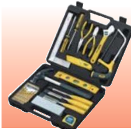
D71282 НАБОР ИНСТРУМЕНТОВ, 21 ПРЕДМЕТ СЕРИЯ DRAPER VALUE

Draper Value. Удобный в домашнем хозяйстве набор инструментов. Поставляется в переносном футляре, изготовленном методом пневматической формовки.