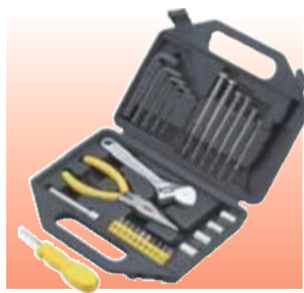
D69450 НАБОР ИНСТРУМЕНТОВ, 29 ПРЕДМЕТОВ СЕРИЯ DRAPER VALUE

Draper Value. Удобный в домашнем хозяйстве набор инструментов. Поставляется в футляре, изготовленном методом пневматической формовки.