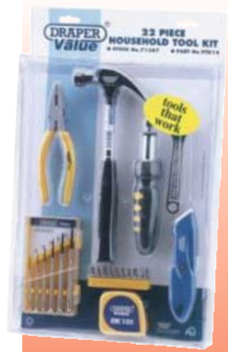
D71387 НАБОР ИНСТРУМЕНТОВ, 22 ПРЕДМЕТА СЕРИЯ DRAPER VALUE

Draper Value. Удобный в домашнем хозяйстве набор инструментов. В прозрачном пластиковом лотке.