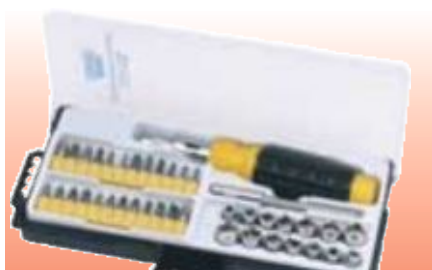
D69939 НАБОР ИНСТРУМЕНТОВ, 48 ПРЕДМЕТОВ СЕРИЯ DRAPER VALUE

Draper Value. Удобный в домашнем хозяйстве набор инструментов. Отвертка с реверсивным трещоточным механизмом снабжена магнитным держателем 1/4" вставок. Поставляется в футляре, изготовленном методом пневматической формовки.