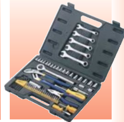
D71271 НАБОР ИНСТРУМЕНТОВ, 60 ПРЕДМЕТОВ СЕРИЯ DRAPER VALUE

Вставки Draper TX-STAR совместимы с крепежом Torx. Torx – зарегистрированная торговая марка компании Samcat/Textrol Inc.