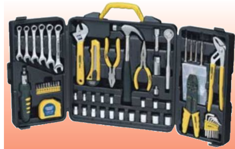
D71381 НАБОР ИНСТРУМЕНТОВ, 60 ПРЕДМЕТОВ СЕРИЯ DRAPER VALUE

Draper Value. Удобный в домашнем хозяйстве набор инструментов. Поставляется в футляре, изготовленном методом пневматической формовки.