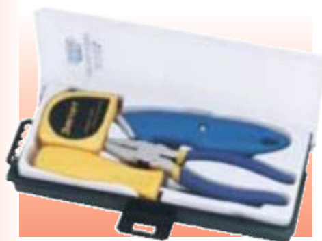
D69938 НАБОР ИНСТРУМЕНТОВ, 4 ПРЕДМЕТА СЕРИЯ DRAPER VALUE

Draper Value. Удобный в домашнем хозяйстве набор инструментов. Поставляется в футляре в извлекаемом отсеке.