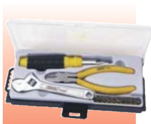
D72150 НАБОР ИНСТРУМЕНТОВ, 13 ПРЕДМЕТОВ СЕРИЯ DRAPER VALUE

Draper Value. Удобный в домашнем хозяйстве набор инструментов. Поставляется в футляре в извлекаемом отсеке.