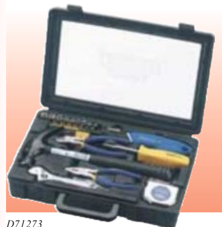
D71273 НАБОР ИНСТРУМЕНТОВ, 34 ПРЕДМЕТА СЕРИЯ DRAPER VALUE

Draper Value. Удобный в домашнем хозяйстве набор инструментов. Поставляется в футляре, изготовленном методом пневматической формовки.